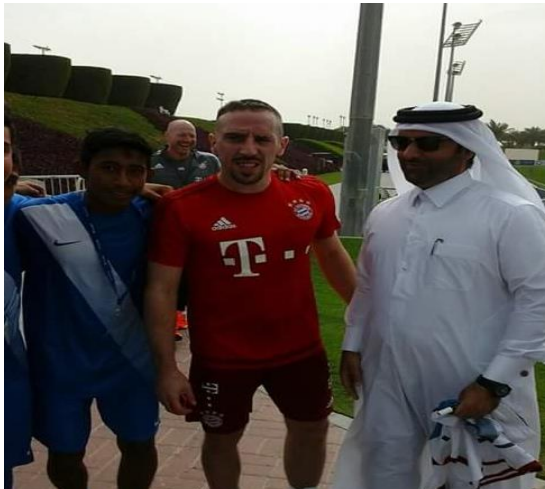
Aspire Football Dreams (Qatar) – 2016