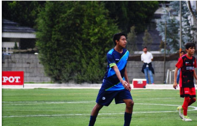
Achik (Tercera División Guatemala) – 2018