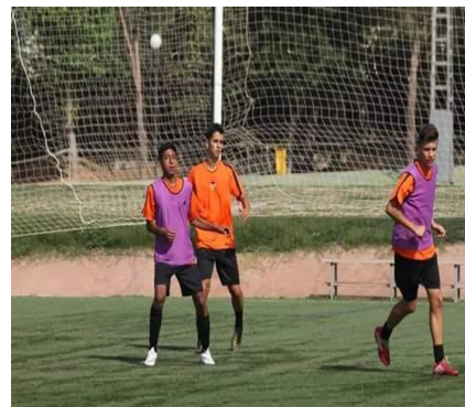
Pasantía en Valencia CF (España) - 2015